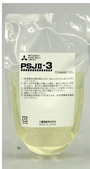
容器変更品 (透明ソフトパック)